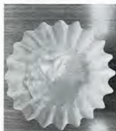
運動前に食す「BCAAゼリー」

兵 庫県加古川市を中心に医療・介護・保育サービス事業を展開する（一社）日の出医療福祉グループは、7月1日、全国でも珍しい「身体リハビリ」の前に「栄養リハビリ」を提供するデイサービス「カラ西神」を神戸市西区にオープンした。