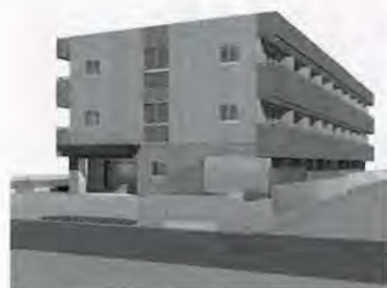
24時間体制で介護・看護サービスが提供できる

大 和ハウスグループで賃貸住宅事業を手がける大和リビング株式会社は、東京都八王子市に同社14カ所めとなるサービス付き高齢者向け住宅「D'Essaめじろ台」を10月1日に開設する。 場所は、JR中央線「西八王子」駅「高尾」駅よりバスで約6分、「陵南中学校」西郵便局入口「停留所下車徒歩3分」に位置。建物は地上3階建て・30戸の規模で、住戸面積は19.00～25.00㎡。25㎡の住戸にはミニキッチンも備える。 運営および生活支援サービスの提供は八王子保健生活協同組合で、1階には同組合が運営する定期巡回・随時対応型訪問介護看護事業所（連携型サテライト）、および通所介護事業所が入る。 月額費用は賃料、共益費、生活支援サービス費、食費（1日3食×30日換算）で15万0600～17万0600円。