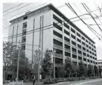
人工温泉の大浴場やレストランなど、充実した共用部をもつ

フージャースホールディングス https://www.hoosiers.co.jp/