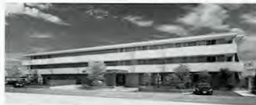
併設する各事業所との連携で医療・介護ニーズに応える

月額費用は、賃料+共益費+生活支援サービス費+食事サービス費で26万1,000～26万3,000円。