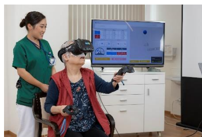
VRリハビリプログラム

日の出医療福祉グループは、9月28日(土)、「大西メディカルクリニック 通所リハビリテーションセンター」などで、2020年新卒者のリクルートを目的に、「VRを活用したリハビリテーション体験」ができる施設見学会を開催します。