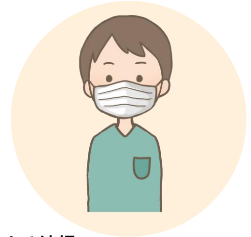
スタッフのマスク着用