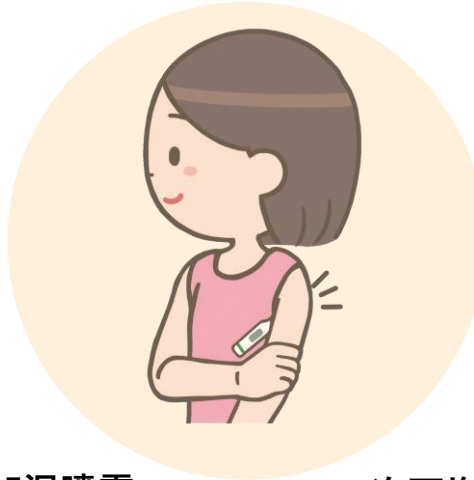
入館時の体調確認と検温