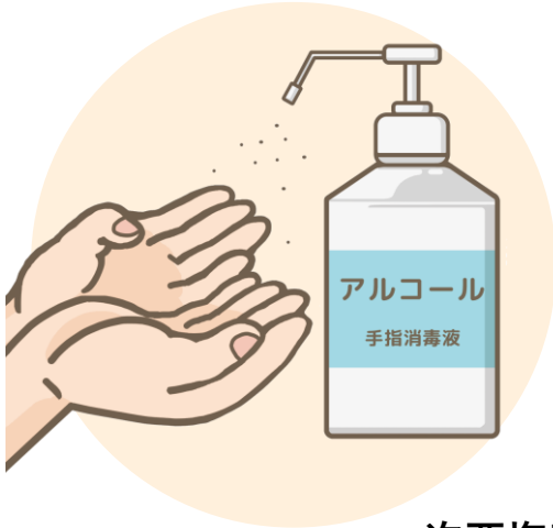
アルコールでの手指消毒