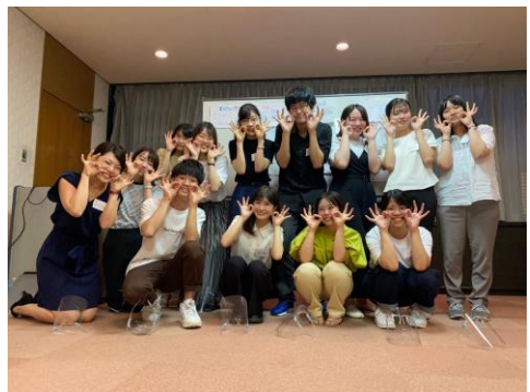
インターンシップ終了後の記念写真