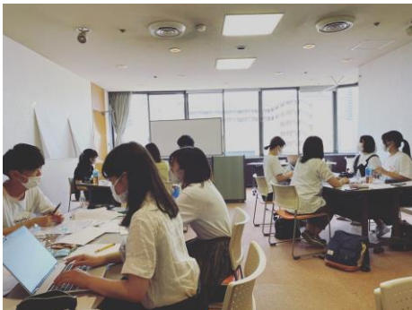
インターンシップでのグループワーク

この現状を見て、IT系企業のコンサルも受け、非福祉系の学生を集客するためには、まず、彼らが漠然と感じている、「自分はどのような社会人になりたいのか、どんな人生を送りたいのか、自分が充実感を味わえる時はどんなときなのか」という不安に対し、私たちが真剣に向き合うことではないかと考えました。