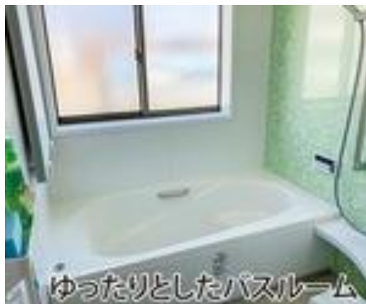
ゆったりとしたバスルーム