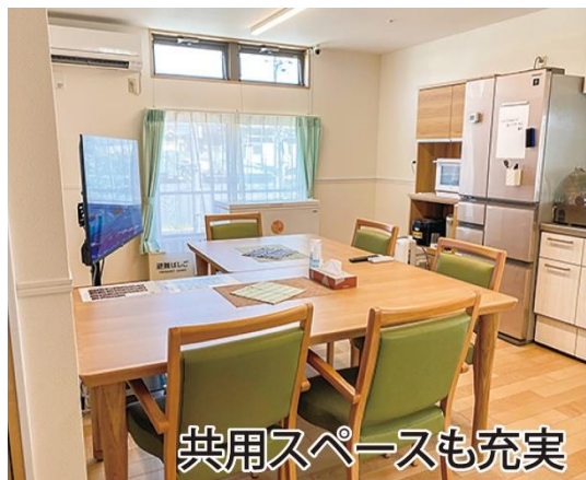
共用スペースも充実