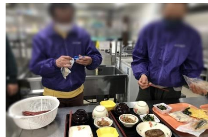
通所リハビリテーション センターでの調理作業