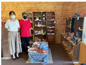
「だかし屋キューブ」