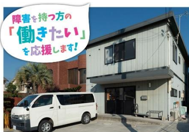
「のじぎく高砂」外観