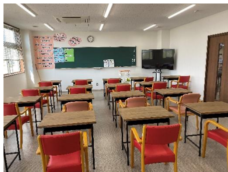
いなみ学習院教室内部