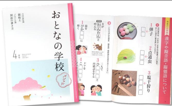
おとなの学校メソッド 教科書