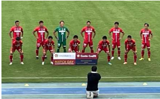
「スポーツ枠」採用（フェントウレハリマ）