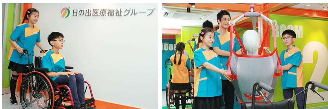
キッズニア甲子園 パビリオン「ケアサポートセンター」

このようなキッズニア甲子園への出展及び体験者への当グループのパンフレット配布等を通じ、将来の介護の担い手である小学生等に対して、介護の仕事を啓蒙するとともに、同伴者の保護者等（社員法人の従業員含む）に対しても、介護業務の理解促進や当グループのイメージアップにより、介護人材の定着化（社員法人における従業員の離職防止）を促進し、当グループでの人材確保・定着に繋げていきます。