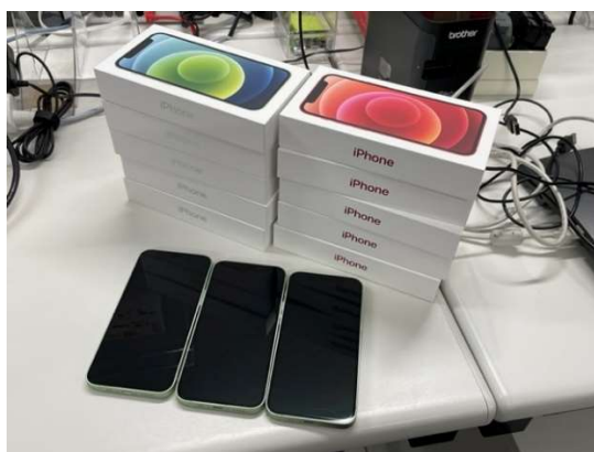
携帯電話の一括発注