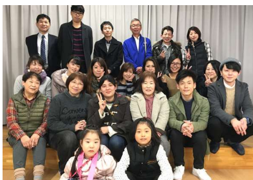
介護職員初任者研修修了風景（2018年）