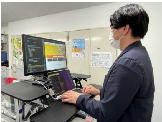
Webサイトの制作・編集