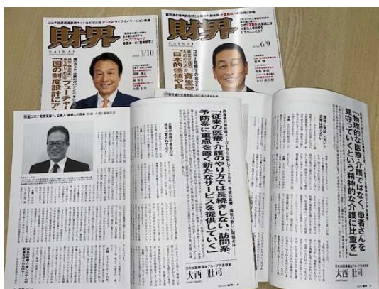
代表理事へのインタビュー記事