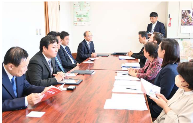
締結後の歓談の様子