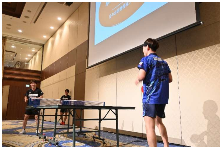
入社後の懇親会にて卓球を披露